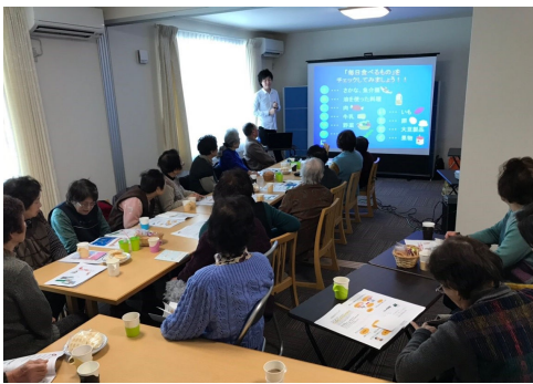
自分の身体年齢はいくつでしょう？

地域の防災について等と毎回参加している皆様に楽しんで頂ける催しを企画しています。