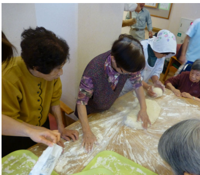
ご利用者、職員とお餅を丸めます。