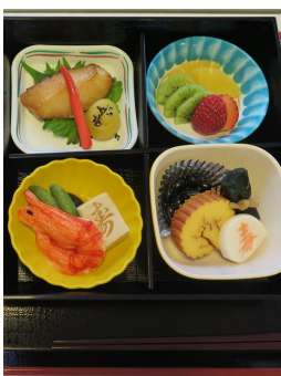
おせち料理に舌鼓