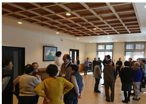
頭と身体を使った体操でリフレッシュ！

毎月第二土曜日、補陀寺会館「こころ」にて十時〜十二時まで開催しております。お近くを通り際には、是非お気軽に足を運んで下さい。また会館だけに限らず野外での活動も行っていくとうと検討中ですので、ご期待ください。