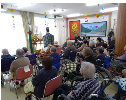
お神酒を頂き、清められました。

今年も光峰苑グループでは、新春の行事として一月九日に新春健康祈願祭を行っています。全事業所のご利用者にお集まりいただき、厳粛な雰囲気の中儀式が粛々と進められ、皆様神妙な面持ちで手を合わせお祈りをしていました。各事業所の代表ご利用者の方々が、宮司より玉串を受け取り、お供えをしてもらい滞りなく行われました。最後にはお神酒をいただき、今年一年の健康を祈願されました。