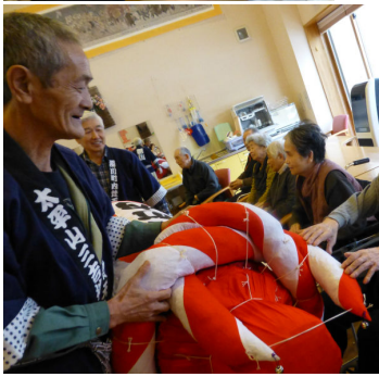
長寿と健康の願いを込めて