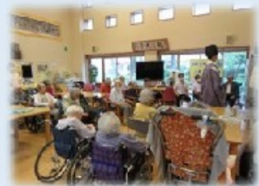
三吉神社様より、龍神様の魂入れをしていただきました