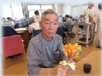
男性ご利用者に手作りで作った花を持っていただきカメラをバシャリ♪