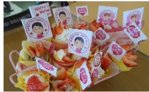
出来立てのクレープの完成！思わずよだれが…

広がりの「美味しそうな匂いだなあ」との声が上がりまわらかく、ご利用者の皆様から「もっと食べたかったなく」と大好評でした。