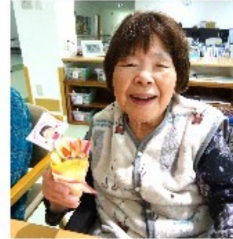
クレープはとても好評でした！