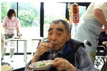
手が止まらないほどの美味しさ！

というところで、特養光峰苑では6月16日に居酒屋風茶話会を行いました。職員お手製のメニュー表や看板を準備し、枝豆、肉団子、餃子の他にノンアルコールビールやカクテル等、多様なメニューを準備し皆様に振る舞いました。ご利用者の皆様からは「お酒のつまみにピッタリ！」等と好評で、笑顔が絶えない時間を過ごしました。