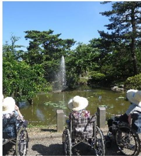
噴水からのマイナスイオンを浴びています。

まだ激しい時期でしたが、体調を崩すことなく、皆様楽しく過ごされました！ 今後も天候をみて季節を感じていただけるように出かけていきます。