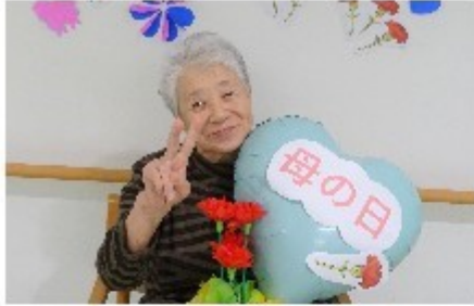
カーネーションと共に笑顔で一枚！

5月の第二日曜日は母の日でしたが、当施設でも日頃より母のように暖かく見守って下さる女性ご利用者の皆様にささやかではございますが、感謝の気持ちとしてカーネーションを贈呈し記念撮影を