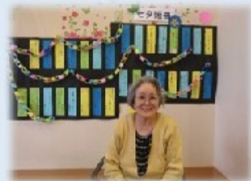
皆様に短冊へ願い事を書いていただきました。願いが届きますように…