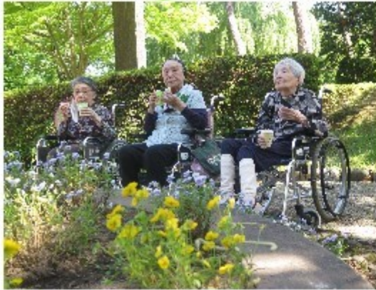
季節の花にうっとり！

特養ほどの中では初夏のドライブということで、千秋公園へ行きました。季節をより感じていただけるように公園内を散策し、久しぶりに外の景色や空気を直接感じたご利用者からは普段では見られない眩しい笑顔がみられました。寒暖差が