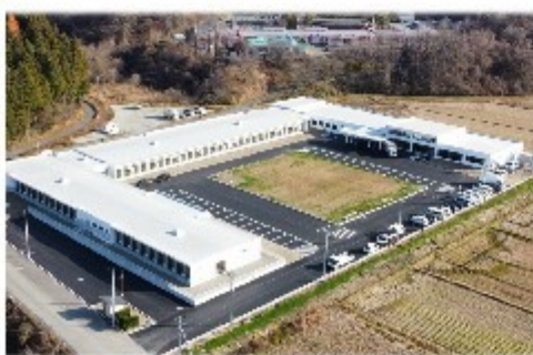
キャッチフレーズは ～緑きらやか矢坂の郷～