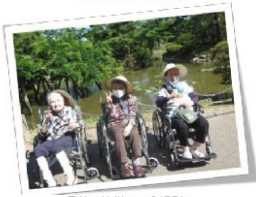
最後に皆様で記念撮影！

特養ほどの中では初夏のドライブということで、千秋公園へ行きました。季節をより感じていただけるように公園内を散策し、久しぶりに外の景色や空気を直接感じたご利用者からは普段では見られない眩しい笑顔がみられました。寒暖差が